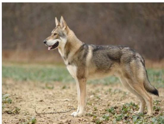
Chien-loup de Saarloos